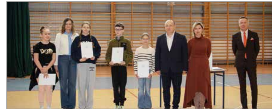
Tegoroczni laureaci stypendiów Wójta Gminy Pomiechówek.