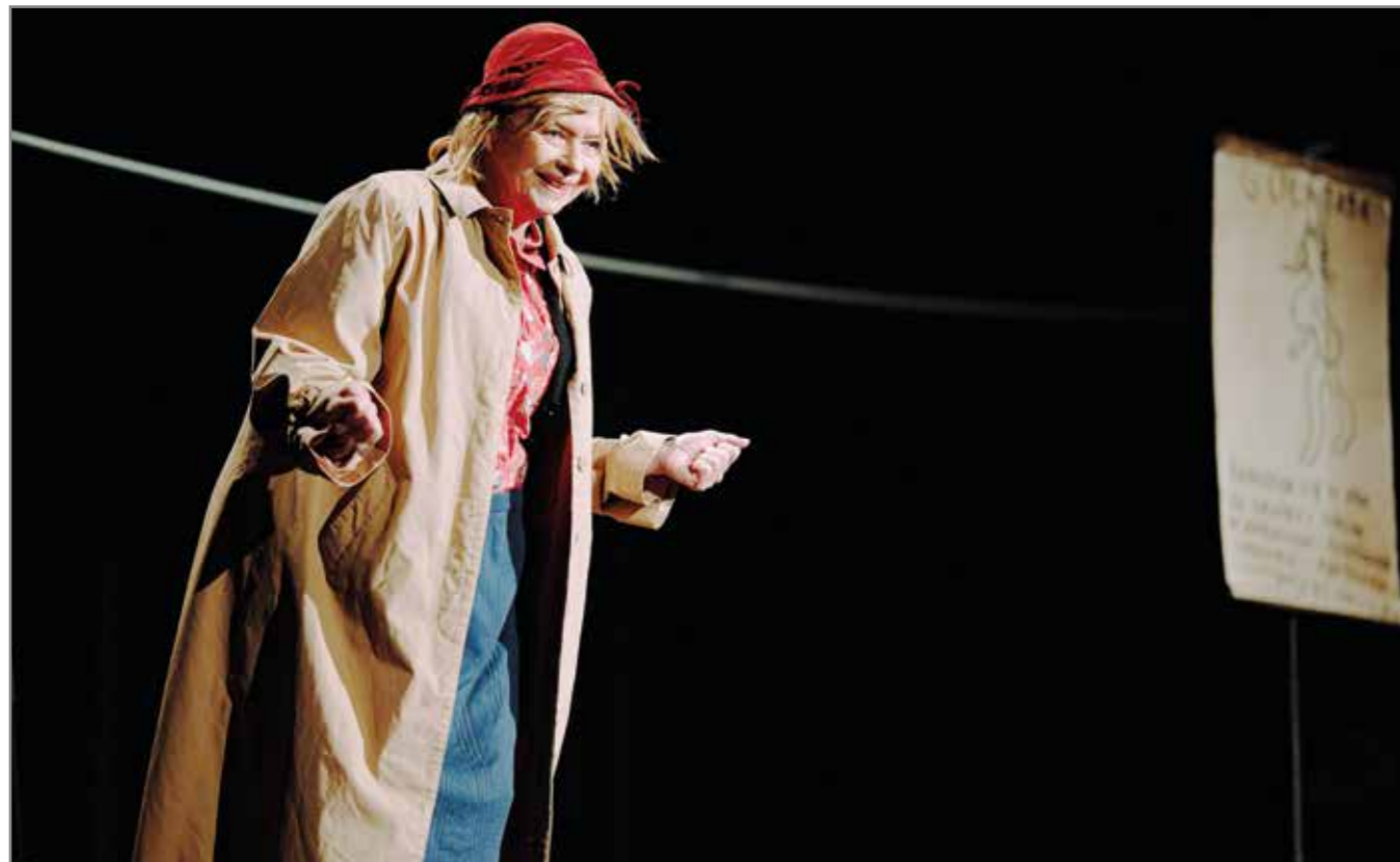
Joanna Szczepkowska w sztuce „Goła Baba” już w kwietniu na pomiechowskiej scenie.