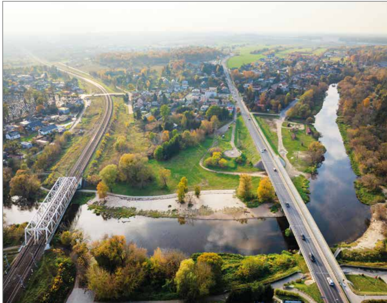
Przez półtora wieku kolej napędzała rozwój Pomiechówki. Dziś jej obecność, w połączeniu z drogą krajową 62 - jest dla nas dużym codziennym wyzwaniem.