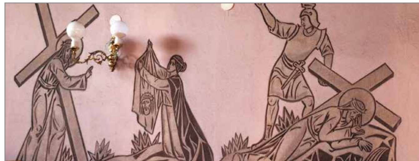
Droga krzyżowa – fragment, kościół w Pomiechowie.