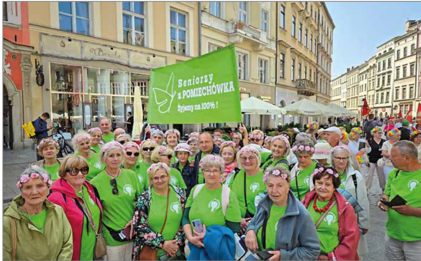
Nasi przedstawiciele podczas Senioraliów w Krakowie.