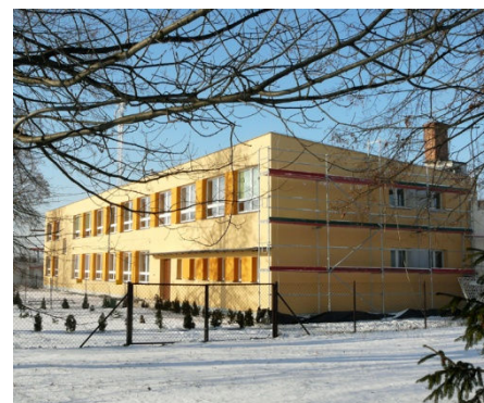
Szkoła Podstawowa w Goławicach

W tym roku uznaliśmy za konieczną również termomodernizację oraz wykonanie zewnętrznych elewacji budynków szkół. Na wiosnę zakończyły się prace na budynku Szkoły Podstawowej w Goławicach Pierwszych, które rozpoczęto jesienią ubiegłego roku. Natomiast w Starym Orzechowie od października trwają prace przy termomodernizacji szkoły. Termin ich zakończenia planowany jeszcze w bieżącym roku uzależniony jest jednak od warunków atmosferycznych. W przypadku obu inwestycji udało się uzyskać dotacje z Ministerstwa Edukacji Narodowej.