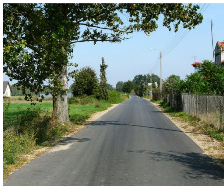
Droga w Wymysłach

Metodą potrójnego powierzchniowego utwardzenia nawierzchni emulsją asfaltową wykonana została modernizacja dróg gminnych w miejscowości Cegielnia-Kosewo. Dzięki korzystnemu rozstrzygnięciu przetargu na realizację tej inwestycji udało się przebudować większą niż pierwotnie zakładano długość drogi i wyniosła ona ok. 1500 m (z wcześniej zakładanych 1170 m) za łączną kwotę 204 195,44 zł.