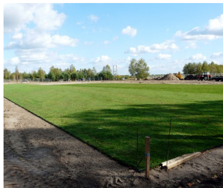
Boisko w Czarnowie

Z kolei od lipca do października trwały prace związane z budową boiska sportowego w Czarnowie. W ramach tego przedsięwzięcia powstało pełnowymiarowe boisko trawiaste do gry w piłkę nożną z systemem drenażu i automatycznego nawadniania. Teren ten został ogrodzony. Również ta inwestycja została dofinansowana ze źródeł zewnętrznych.