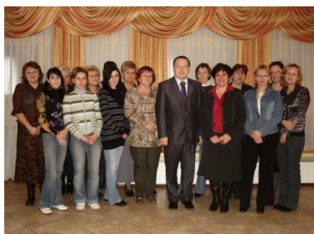
Pamiątkowe zdjęcie na zakończenie projektu

Ośrodek Pomocy Społecznej w Pomiechówku z satysfakcją informuje, że zakończył realizację projektu systemowego „ RADZĘ SOBIE – aktywizacja społeczno-zawodowa dla osób niepracujących z terenu gminy Pomiechówek ”. Projekt realizowano w okresie od 01.05.2009 do 30.11.2009, koszt projektu 118 759,00 zł z tego 106 289,31 zł to środki unijne. W projekcie wzięło udział 10 pań niepracujących z terenu gminy Pomiechówek.