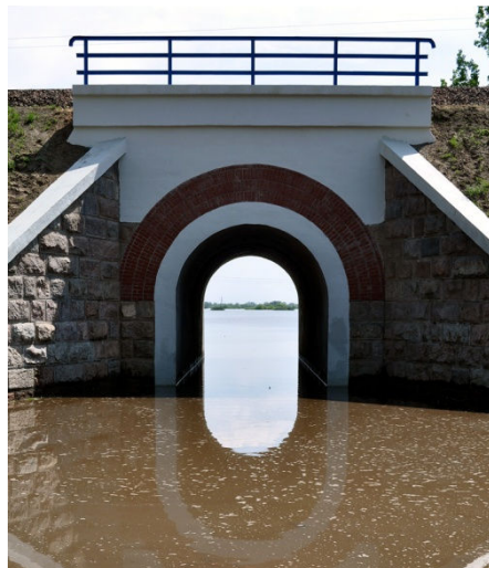
Wysoka woda na Bronisławce

Podstawą pomocy był protokół strat gminnej komisji oraz wywiad środowiskowy w miejscu zamieszkania przeprowadzony przez pracownika socjalnego. Pomoc w formie zasiłków celowych została udzielona 42 rodzinom na kwotę 175 879 zł , w tym 24 rodzinom na remont budynku mieszkalnego i pierwszą pomoc na kwotę 168 000 zł (środki Wojewody) i 18 rodzinom